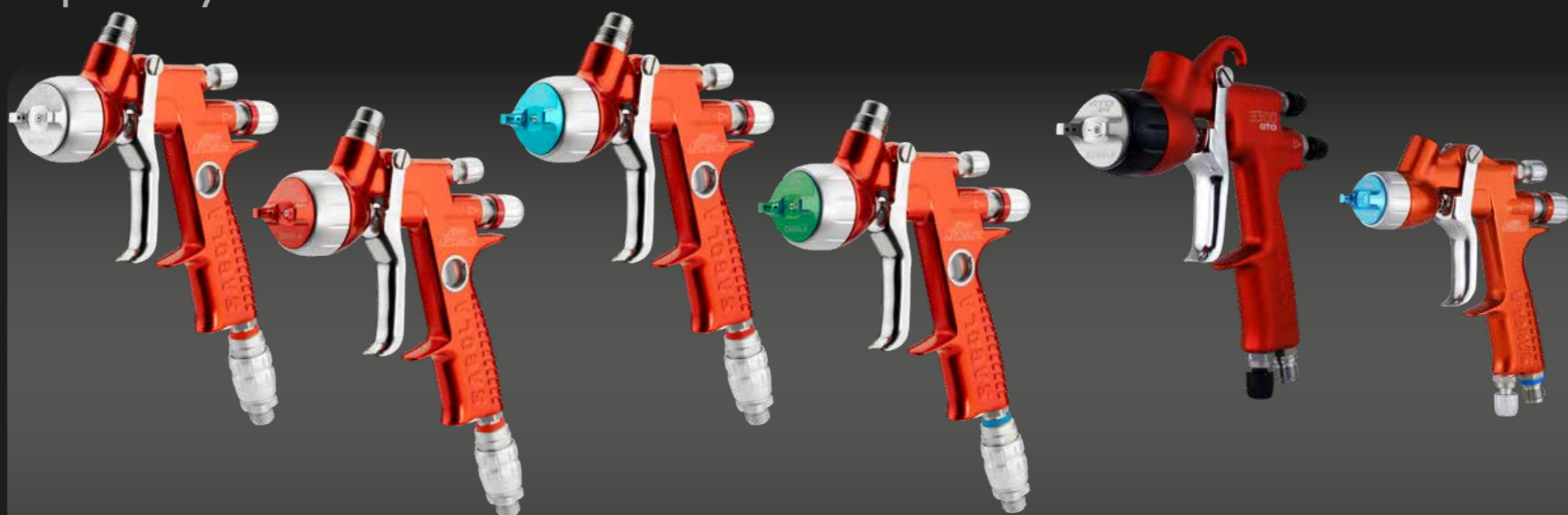
4600 Xtreme TITANIA PRO